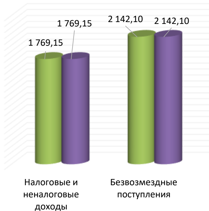
Изменения налоговых и неналоговых доходов и безвозмездных поступлений от бюджетов других уровней